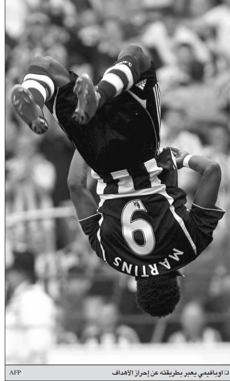
ق اوبافيمي يعبر بطريقته عن إحراز الاهداف

أفرا - AFP يحل مهاجم نيوكاسل ومنتخب نيجيريا لكرة القدم اوبافيمي مارتينز بتسجيل اهداف كثيرة في نهائيات كأس امم افريقيا الـ 26 المقامة في غانا حتى 10 فبراير المقبل لمعادلة إنجاز قوته مواطنه رشيدي بكيني هدا نسخة عام 1994 في تونس. ويحتل بكيني المركز الثاني في تاريخ هدافي نهائيات كأس امم افريقيا برصيد 13 هدفاً بفرق هدف واحد خلف الهداف التاريخي العاجي لوران بوكو. علماً بأنه أفضل مسجل في تاريخ المنتخب النيجيري برصيد 37 هدفاً، فيما سجل مارتينز 13 هدفاً في 19 مباراة حتى الآن. وقال مارتينز «أريد مواصلة لتسجيل العديد من الاهداف لأصبح أحد أفضل الهدافين في العالم». مضيفاً «لم تحزر أي لقب منذ فترة طويلة وانصارتنا ينتظرون الشيء الكثير منا». وتابع «إنهم ينتظرون منا الفوز باللقب في غانا وأتمنى أن تساعد الاهداف التي ساسجلها في تحقيق هذا الهدف والحلم الذي طالما راودنا». ويأمل مارتينز باللقب «أوباغول» تيمناً بمهاجم الارجنتين السابق غابريال باتيستوتا الملقب بـ «باتيستول» في أن ينسى نهائيات امم افريقيا التي اقيمت في مصر حيث سجل هدفين فقط في 6 مباريات وحقق كأساً غير كافيين لتفادي خروج منتخب بلاده من الدور نصف النهائي. منذ بداياته الدولية في مايو 2004 ضد جمهورية ايرلندا وانتقاله من إنتر ميلان الإيطالي